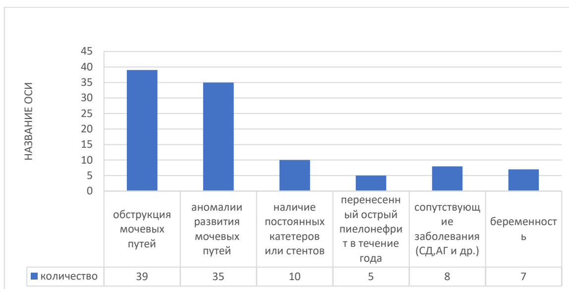
Рис.4. Причины острого пиелонефрита

Анализ возможных причин показал следующие наиболее частые причины развития острого пиелонефрита среди обследованных: Обструкция мочевых путей – 39 случаев (37,5 %), аномалии развития мочевых путей – 35 случаев (33,7 %), наличие постоянных катетеров или стентов – 10 случаев (9,6 %), перенесённый острый пиелонефрит в течение года – 5 случаев (4,8 %), сопутствующие заболевания (сахарный диабет, артериальная гипертензия и др.) – 8 случаев (7,7 %), беременность – 7 случаев (6,7%) (рис 4).