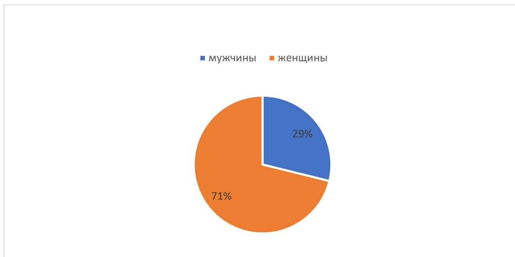
Рис.1. По половому признаку

В данном исследовании был проведен анализ 104 историй болезней пациентов с острым пиелонефритом, получивших стационарное лечение в Ж.Абадской областной, Сузакской районной территориальной больницы за 2024–2025 годы. Среди них 29 мужчин (27,9 %) и 71 женщин (72,1 %) (рис 1).